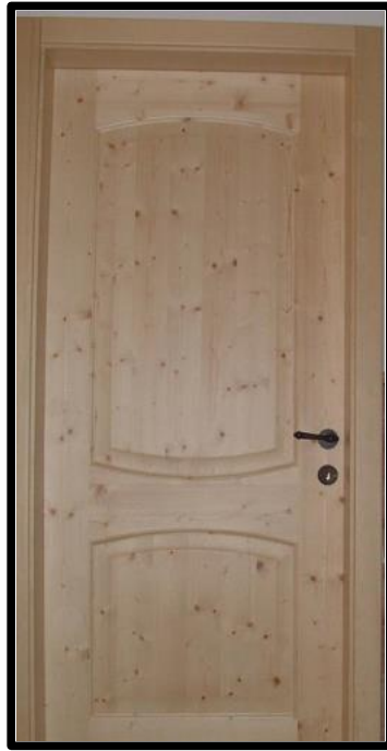
PORTA IN ABETE NATURALE SPECCHIATA