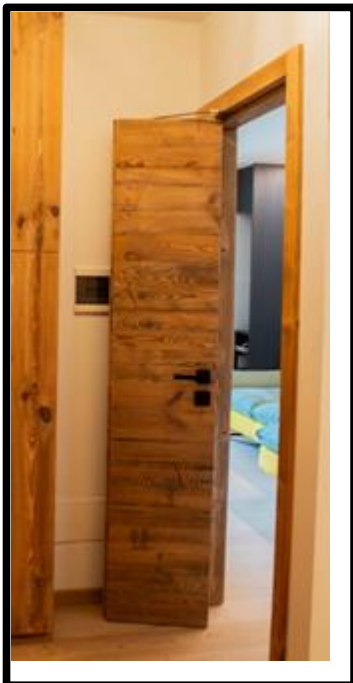
PORTE A PACCHETTO