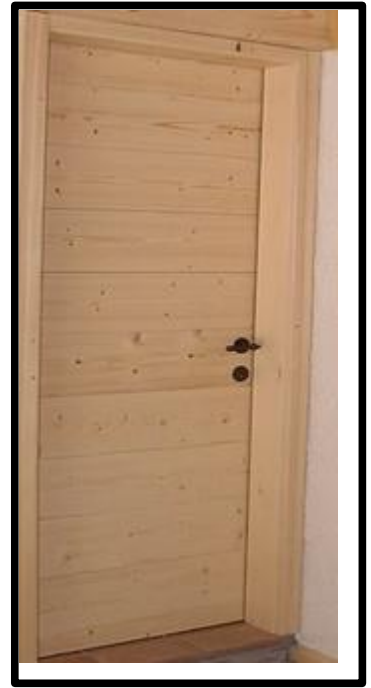
PORTA IN ABETE NATURALE