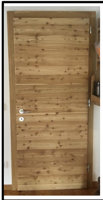
PORTA IN LARICE