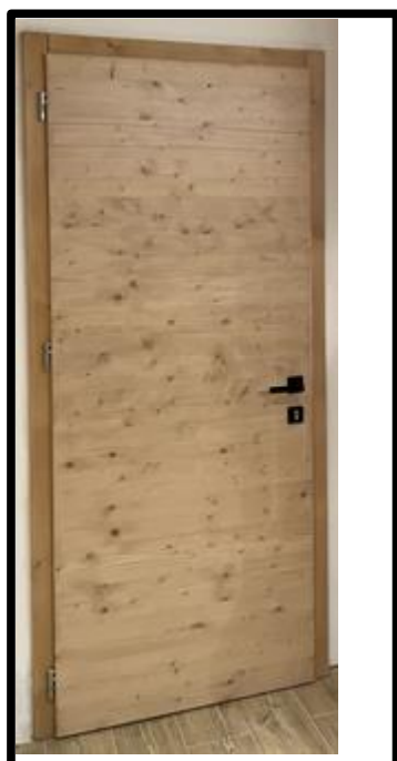
PORTA IN ABETE TINTO