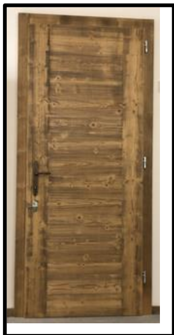
PORTA IN ABETE ANTICATO CON PATINA NERA