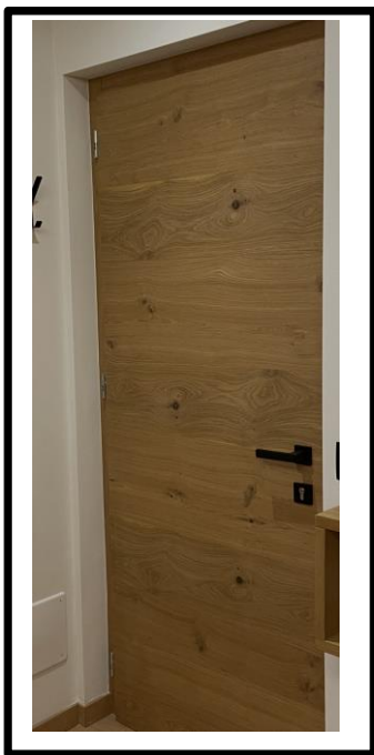
PORTA IN ROVERE