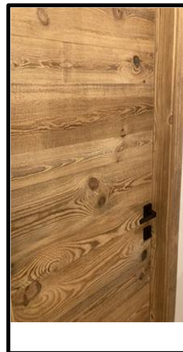
PORTA IN ABETE VECCHIO