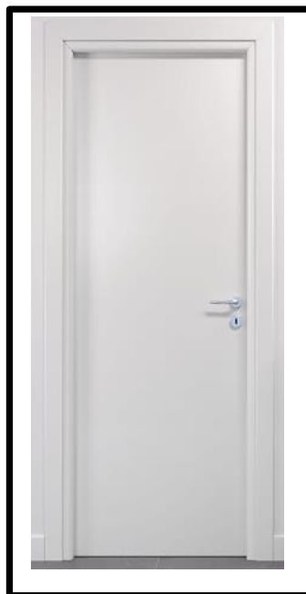
PORTE IN LAMINATO LISCE