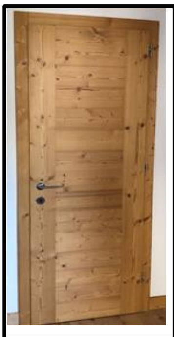
PORTA IN ABETE ANTICATO