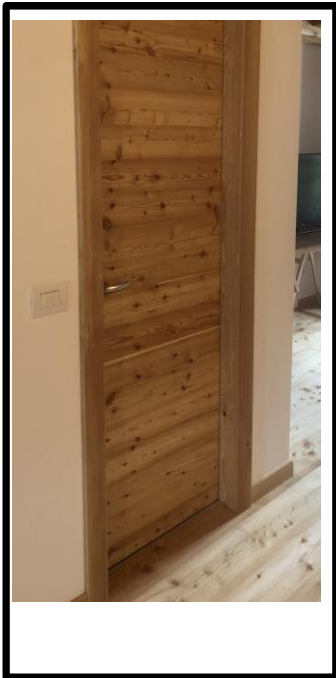
PORTA IN LARICE