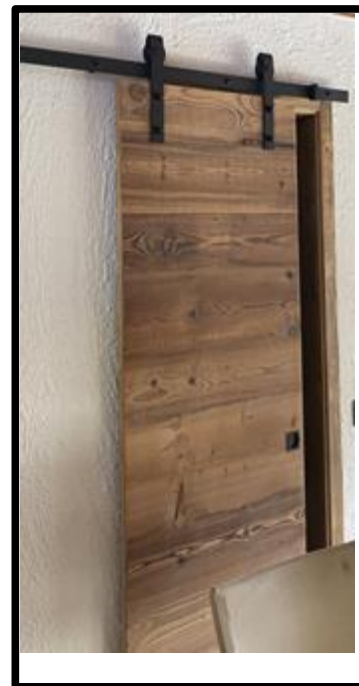
PORTE SCORREVOLI ESTERNO MURO