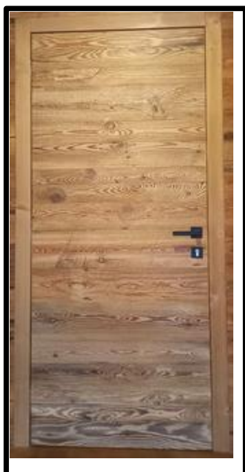
PORTA IN ABETE VECCHIO