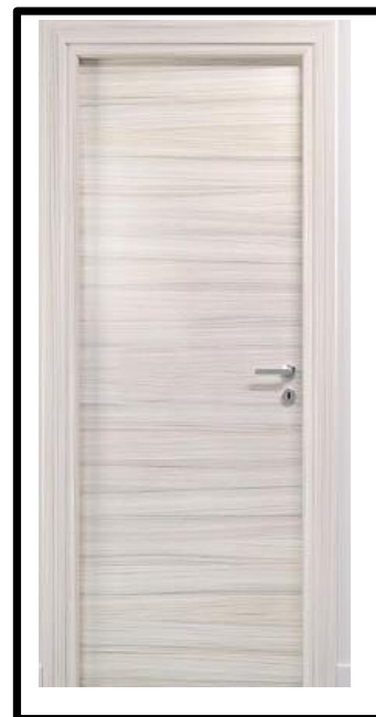
PORTE IN LAMINATO CONVENATURA A VISTA