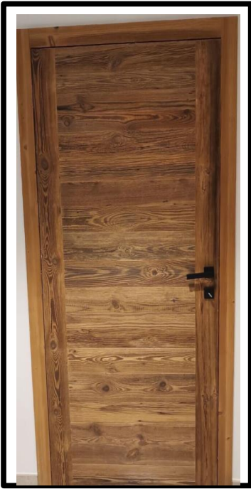
PORTA IN ABETE VECCHIO CON FASCE LATERALI