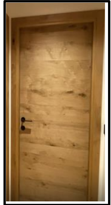
PORTA IN ROVERE